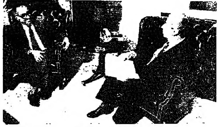
الهراوي مع الوفد الكويتي

من خلال الرسالة التي نقلتها له طلبت دولة الكويت موقفاً معيّناً من لبنان؟ كما نعرف لبنان يفك دائماً مع ويحز وجدة الصف العربي، ويمتدح اي تمزق عربي.